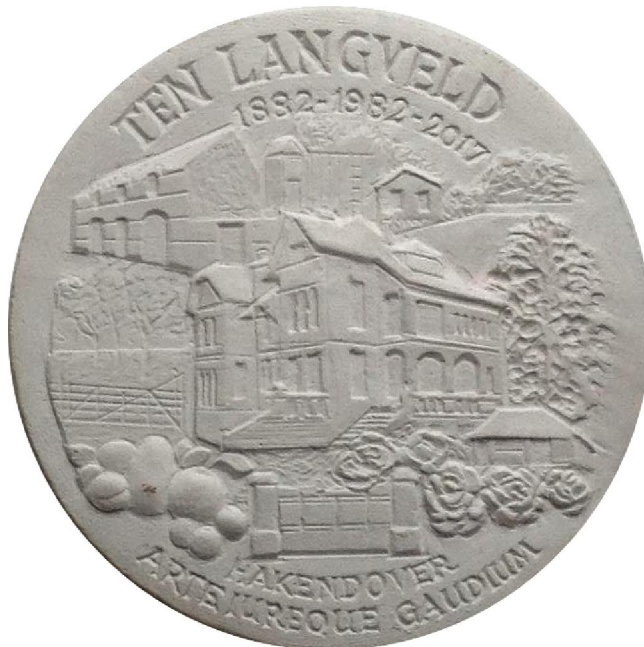
2. onafgewerkt en ongesigneerd basisontwerp