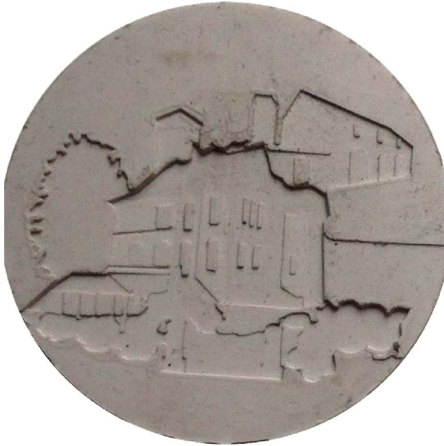
1. ruw spiegelbeeld in siliconen

Ontwerpen door Paul Huybrechts, met de vier creatiestadia (2017)