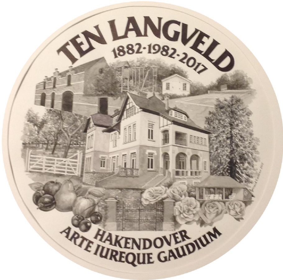
Ontwerp (aquarel in grisaille) door Bernard Keunen uit Hechtel (2015 – Ø 40 cm)