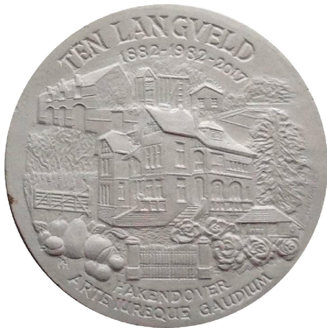
4. definitieve eindvorm in plaaster